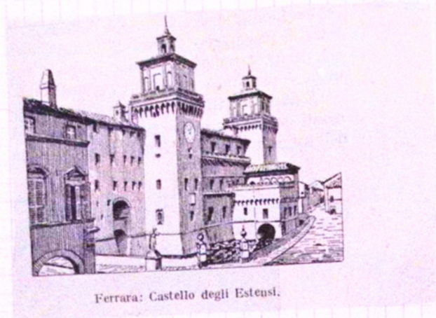
Ferrara: Castello degli Estensi.