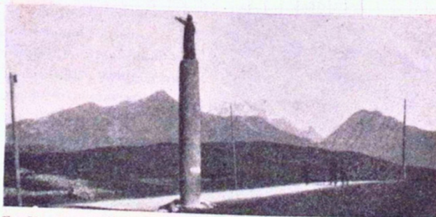
FIG. 19. - Il valico del Piccolo San Bernardo dominato dal M. Bianco nevoso e segnato dalla colonna romana, già sostegno della statua di Giove ed ora di quella di S. Bernardo.